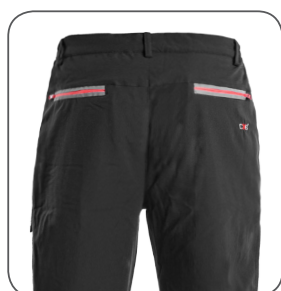
zadní strana back side odwrotna strona