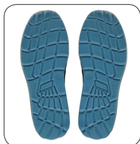
podešev outsole podeszwa